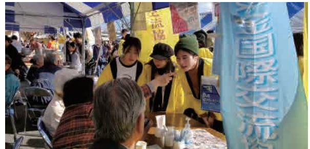
市民と仲良く交流しました

それぞれに、お菓子を添えて一杯100円で販売しました。店のスタッフは、TIFAの理事、会員そして城西国際大学の留学生です。留学生はTIFAの黄色の法被姿でお客様の呼び込み、出前の配達そして接客を手伝ってくれました。