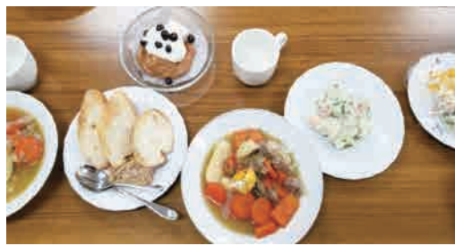
(美味しそうな料理が出来上がりました)

アイルランドは、その緑豊かな自然環境により「エメラルドの島」とも呼ばれます。著名な出身者は、日本でも有名な小説家のラフカディオ・ハーン（日本名：小泉八雲）、オスカー・ワイルド（注1）、ブロンテ姉妹（注2）、アメリカのケネディ家等々。また、あの黒い「ギネスビール」発祥の地であるほか、アイリッシュ・ウイスキーも有名でウイスキーの発祥地ともいわれています。