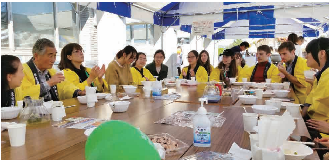
イベント終了後全員でランチ

12時、店を閉じスタッフ全員で昼食を兼ねて懇親会を行いました。販売数は208杯でした。参加してくれた留学生の皆さんありがとうございました。(中村次克理事)