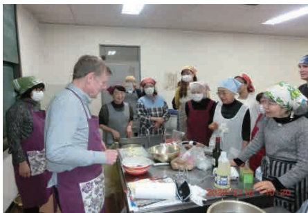
(早くたべたいなあ～)

出来上がった料理をいただきながら、アイルランドの音楽やクイズで楽しく盛り上がりました。今回も皆さん笑顔一杯の世界の料理教室となりました。（佐竹理事）