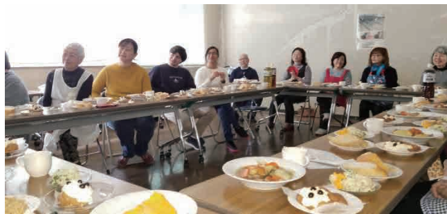
(ハワード講師のお話真剣に耳を傾けます)