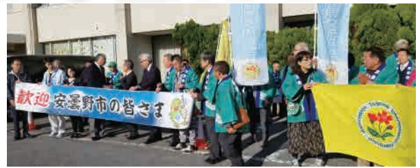
安曇野市長一行をお出迎え

東金国際交流協会(TIFA)は、今年度もワン・コイン・カフェで参加しました。産業祭当日のTIFAの活動をご紹介します。