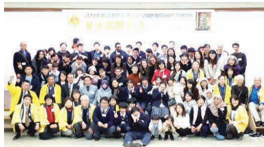
全員揃って記念写真撮影

参加した外国の方は、台湾、中国、韓国、ベトナム、マレーシア、フランス、チェコ、ハンガリー、スロバキア、オーストラリア、アメリカ、ブータン、スリランカそしてインドネシアの方です。