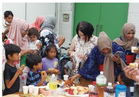
東金VC日本語教室の先生がハラル料理を提供してくれました。