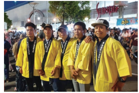
市内の林業会社で働くベトナム人