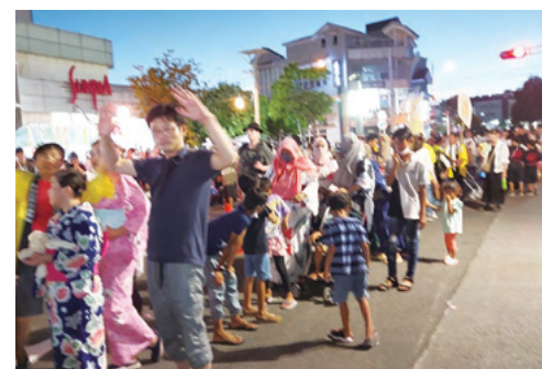
ベビーカーも連に加わり、ヤッサ!ヤッサ!