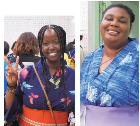
英語指導助手の二人はアメリカから