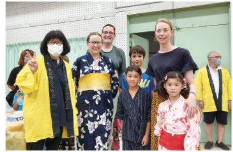
観光で東金を訪れていた ドイツ・オーストラリアの家族